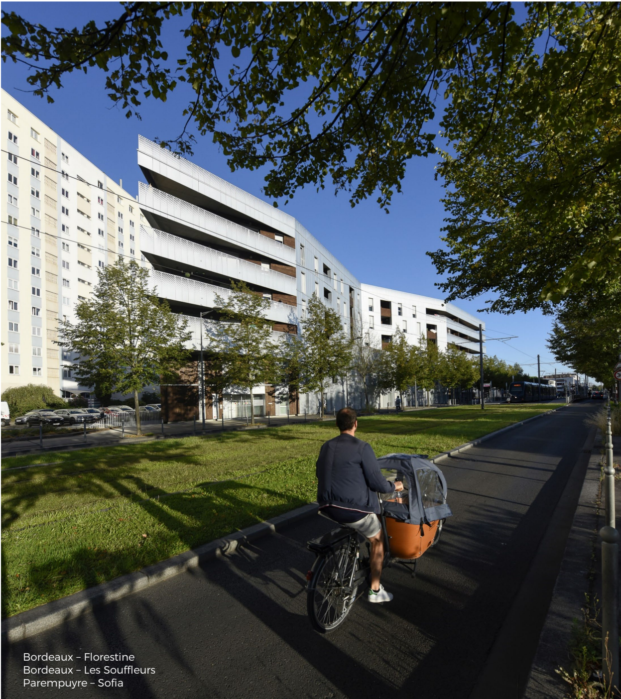
Bordeaux - Florestine Bordeaux - Les Souffleurs Parempuyre - Sofia