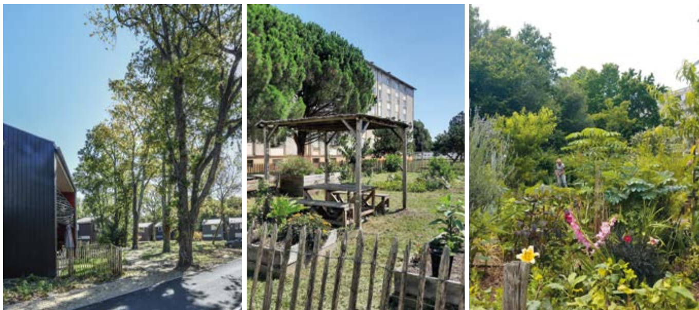
Les aménagements paysagers des résidences Champ de Courses au Bouscat, La Clairière des Pêcheurs à Andernos et Le Dorat à Bègles