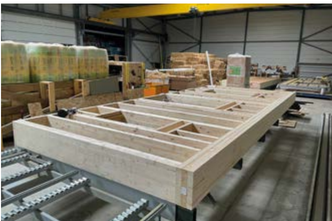
Fabrication des panneaux en bois paille

La nouvelle résidence Le Hameau des Chaumes située à Grignols comporte 14 logements livrés il y a quelques jours. Ils possèdent la particularité de recourir à un système constructif innovant en bois et en paille. Cette dernière est effectivement un très bon isolant permettant en plus de faire appel à un circuit court bénéfique pour l'économie locale. Au total, ce sont 135 tonnes de matériaux biosourcés qui ont été utilisés sur cette opération.