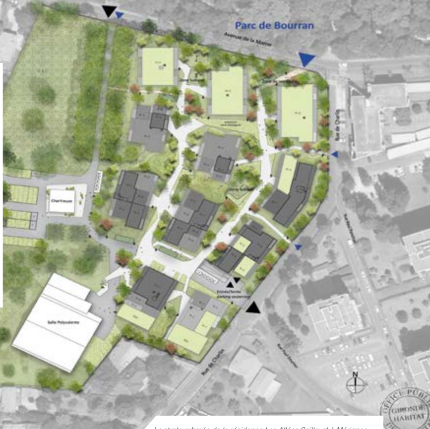
La strate arborée de la résidence Les Allées Caillavet à Mérignac imaginée par l'équipe lauréate du concours (Flint, BPM, TPFI et Haristoy)