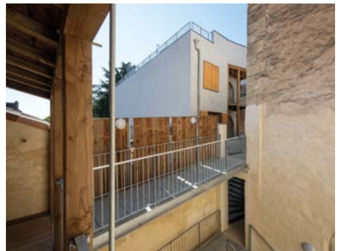
Résidence Le Jardin sur le Toit à La Réole

Au-delà des matériaux biosourcés, c'est le caractère participatif de cette résidence qui est innovant. Il s'agit effectivement de la première résidence conçue de cette manière par Gironde Habitat. Cela se caractérise par l'implication de l'habitant dans la création de son lieu de vie jusqu'à la livraison. L'objectif est de concevoir un logement adapté aux besoins de chacun de manière collective, tout en conservant une dimension sociale et solidaire afin de co-construire un toit intergénérationnel donnant accès à des espaces partagés. Dans cette résidence, il y a par exemple un jardin d'hiver, une terrasse sur les toits et une salle commune, que les habitants ont pu commencer à investir en septembre dernier.