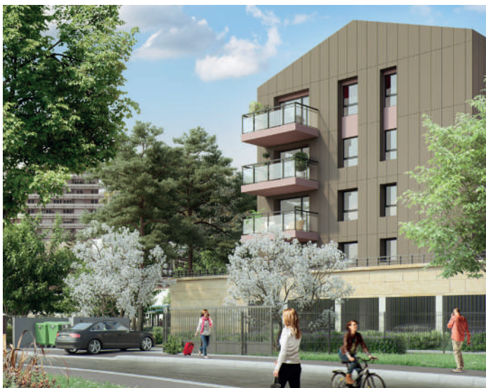
RÉSIDENCE NOBEL BORDEAUX

Le bail réel solidaire BRS est une nouvelle manière d'accéder à la propriété. Ce dispositif qui dissocie le foncier du bâti permet aux futurs acquéreurs de devenir propriétaire là où ils ne l'auraient jamais imaginé.