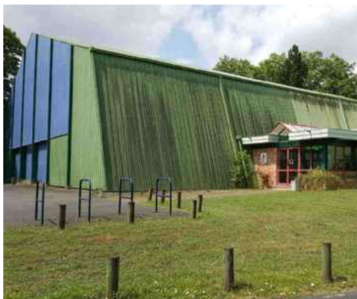
Après acquisition par la commune, le gymnase fera l'objet de travaux de réhabilitation

Lors de la mise en chantier des 200 logements, l'accès au gymnase sera maintenu par l'avenue de la Marne. Les usagers disposeront de places de stationnement bordant les anciens locaux du Conseil d'architecture, de l'urbanisme et de l'environnement (CAUE). Précisons qu'après concrétisation de la cession du gymnase, la Ville envisage une réhabilitation plus conséquente du bâti. L'espace vert alentour devrait lui aussi s'ouvrir plus largement à la population.