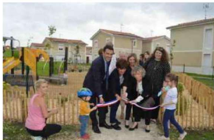
Inauguration des logements sociaux Les Chambres neuves de Gironde Habitat, à Ludon-Médoc.

Quant aux quatre logements collectifs (T2 en R+1), ils sont tous dotés d'un balcon donnant sur les es-