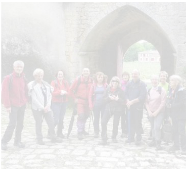
Les randonneurs à leur arrivée au château de Benauge.

Après une reconnaissance, au préalable, de lieux propices aux randonnées et en passant, par hasard, dans le canton targonnais, onze marcheurs se sont arrêtés mardi, en début d'après-midi, au château de Benauge.