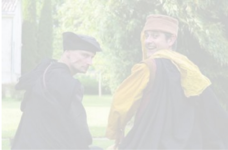
Le Duo d'âge moyen.

Acrocs Production a reçu en résidence durant deux jours à l'espace René Lazare, lundi et mardi, le Duo d'Âge Moyen. Ce duo a travaillé et répété le spectacle musico-burlesque « La Farce tranquille », qu'ils iront jouer demain à Larbey, dans les Landes.