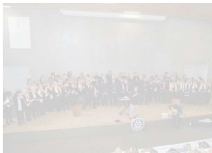
Une centaine de choristes étaient rassemblés sur la scène de l'amphithéâtre du lycée agricole.