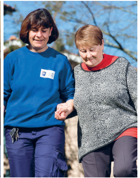
L'attention aux autres, partout sur le territoire girondin